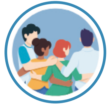
El CONTACTO cercano, como conversaciones cara a cara.

El riesgo de infección o de brotes puede incrementarse cuando las TRES C ocurren al mismo tiempo.