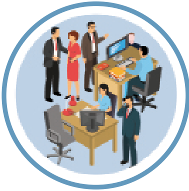
Lugares CERRADOS con poca ventilación.

Espacios CONCURRIDOS o abarrotados de personas.